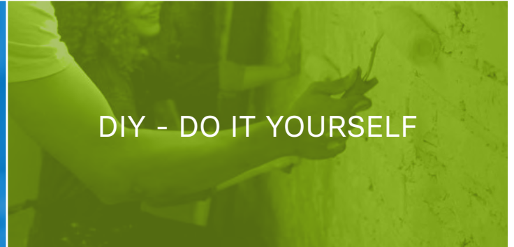
DIY - DO IT YOURSELF